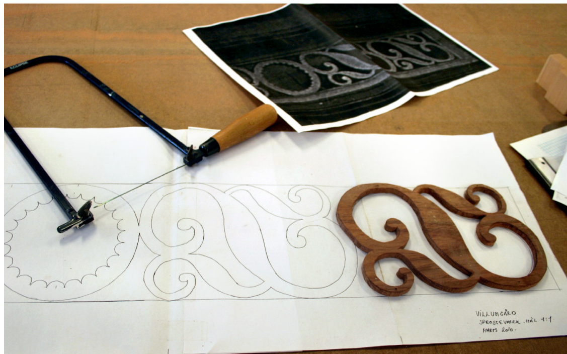
Ovenfor: Genskabelsen af det elegante, filigranagtige sprosseværk i hoveddørens overvindue var en krævende, men ikke uløselig opgave for håndværkerfirmaet i Hjorte. Efter gengivelse i tegning 1:1 blev de dekorative elementer savet ud i mahognitræ med løvsav. På næste side: Det sikre bevis for, hvordan den for længst kasserede hoveddør oprindeligt så ud, leverede et gammelt foto, som blev fundet på det stedlige, lokalhistoriske arkiv. Det er fra ca. 1910 – da der stadig var tjenestefolk på en gård som denne.