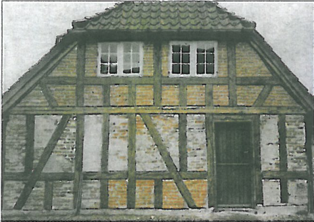
Facaden på Tvedgaard er blevet sandblæst, så bindingsværk og de murede tavler er blotlagt.